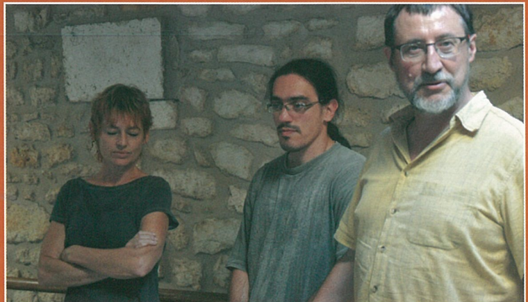
Nouvelle équipe d'EFFERVESCENTRE