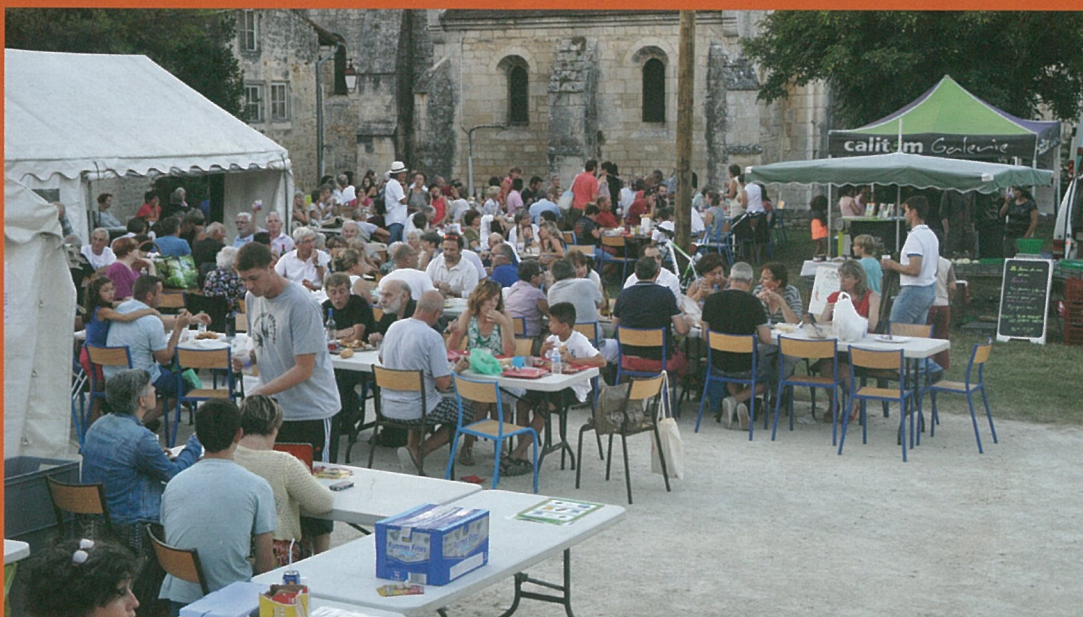
PENDANT LES VACANCES A MOUTHIER, C'EST TABLES DE MULTIPLICATION... DES PLAISIRS !