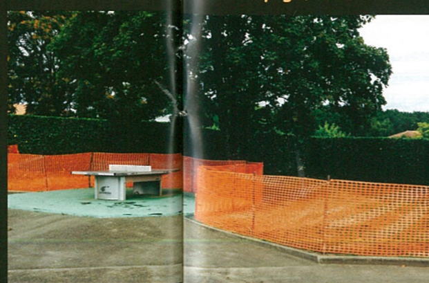
saillage de toute la cour