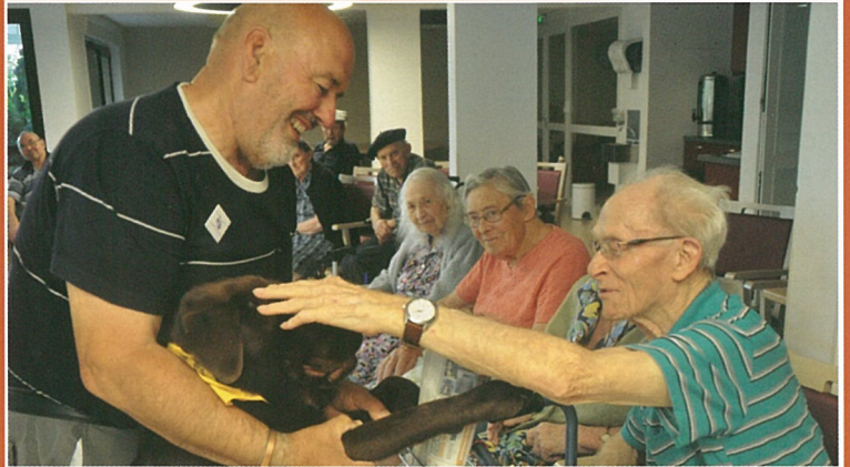
Donne les pattes à l'Ehpad... !

55 bis, rue de la Boème - 16440 MOUTHIER RENSEIGNEMENTS Mme Anne-Marie MARTIGNAC - 05 45 67 84 88