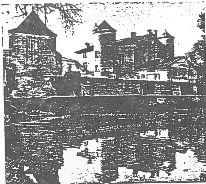
Le château de Forge et ses sources.