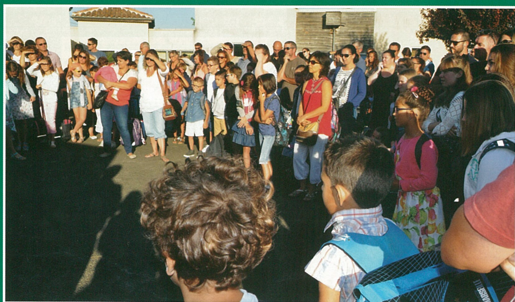
Beaucoup de classe pour la rentrée 2016..!