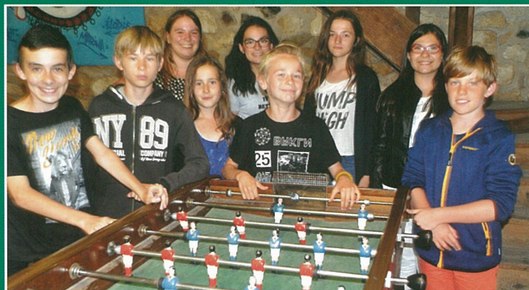
Qui dira que les jeunes s'en baby foot de tout ..?