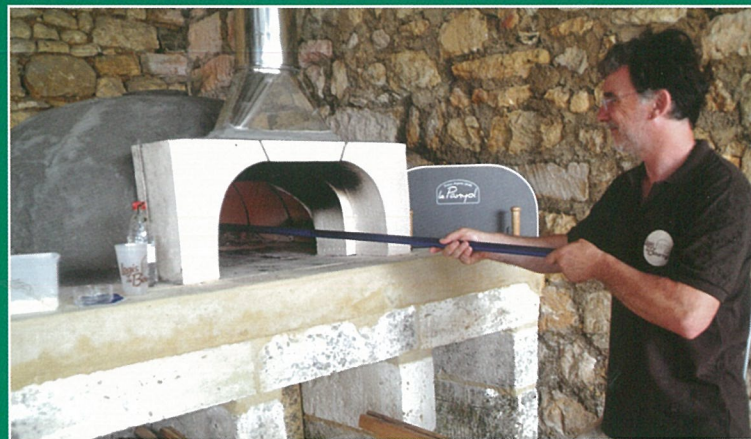
Succès des portes ouvertes au Logis de Bournet ; pourtant ils ont fait un four..!