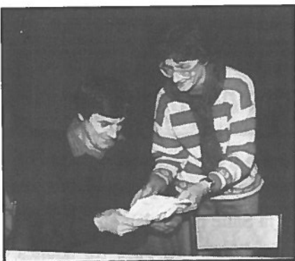
Loto Parents d'élèves.

L'équipe de rédaction de ce bulletin et les associations de Mouthiers qui ont travaillé avec lui, tiennent à le remercier pour sa compétence, sa disponibilité et la qualité du travail accompli et à lui souhaiter une bonne installation à Cahors.