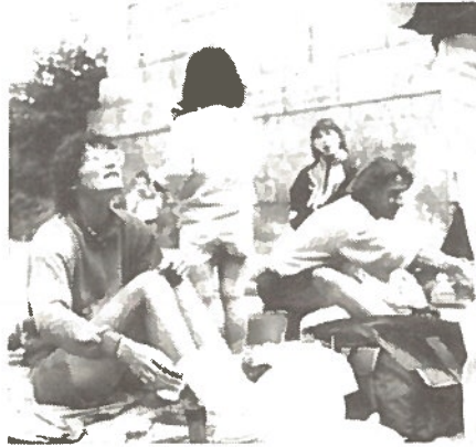
Pendant la sortie GV - Patrimoine

A tous, le bureau de la M.J.C. Jules Berry souhaite des congés profitables et enrichissants : à l'année prochaine !