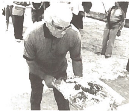
Commemoration de l'Appel du 18 Juin