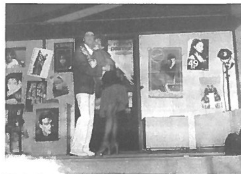
Théâtre du Cœur Vert

Des plaintes pourraient être déposées auprès de la gendarmerie de Blanzac.