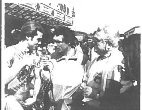
Un Américain à l'arrivée de la 7 ème Ronde la Boème