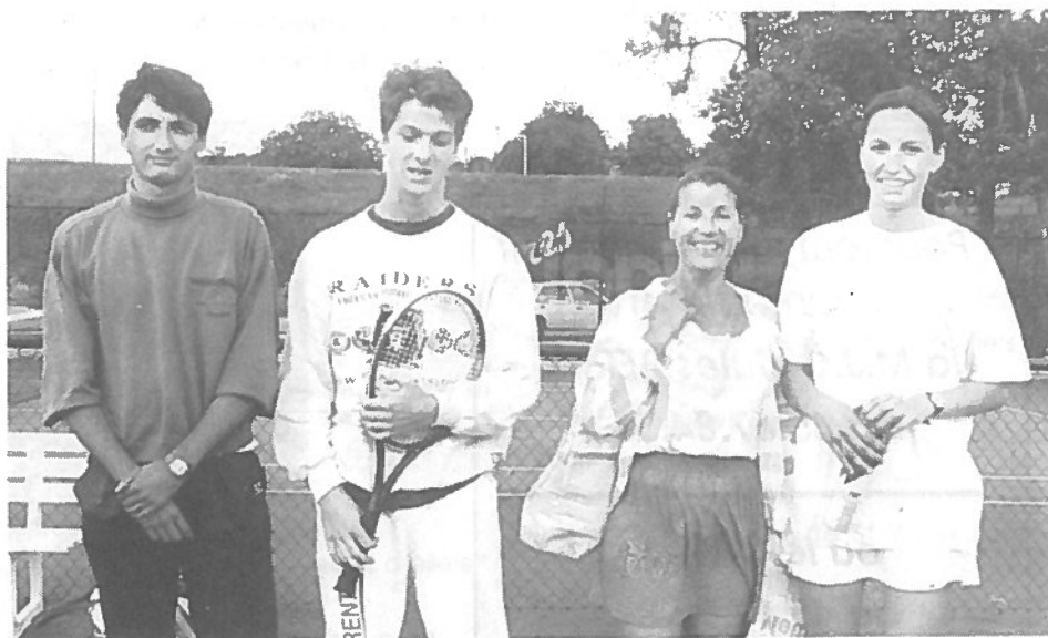
Les vainqueurs de 3 ème et 4 ème série