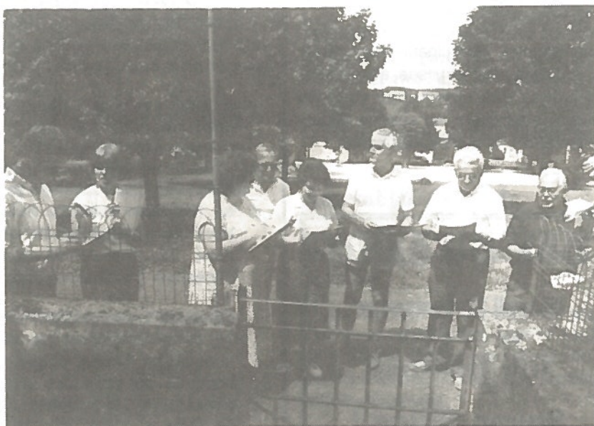
La Commission de Fleurissement au travail.