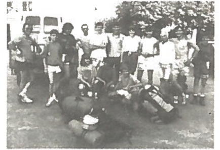
Retour de l'expédition pyrénéenne.

- Mercredi 2 octobre : après le succès de TAMERLAN, le 28 juillet, spectacle grandiose proposé en collaboration avec le Comité des Fêtes et le Conseil Municipal, on pourra voir le 2 octobre, le Gargantua de Rabelais, par le Théâtre de l'Éphémère. C'est la même équipe qui organisera ce spectacle. A ne manquer sous aucun prétexte ; ce sera la dernière représentation et les décors resteront à Mouthiers.