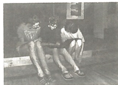
Exposition Africaine à La Maison pour Tous