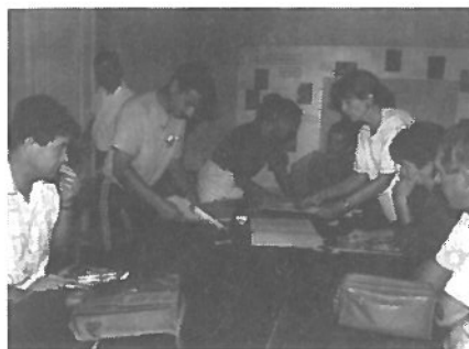
A. G. du Tennis

Les objectifs de la saison 91/92 sont dans la lignée de ceux de l'année écoulée, en ce sens que les cours de l'école de tennis seront dispensés par M. LAVEFVRE, moniteur. Monsieur le Président remercie la Municipalité d'avoir accepté d'augmenter sa subvention sans laquelle l'école de tennis n'aurait pas pu atteindre ce niveau. A plus long terme, les jeunes ainsi formés viendront tout naturellement s'intégrer dans les équipes en y apportant "la fraîcheur de leur jeunesse".