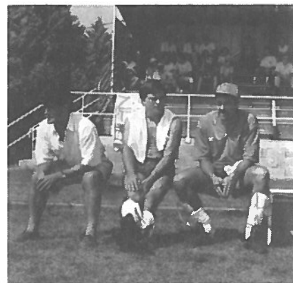
Les dirigeants sur le banc de touche

Le Bureau remercie par avance les parents qui accompagneront les dirigeants lors des déplacements.