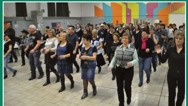
La country garde la ligne !