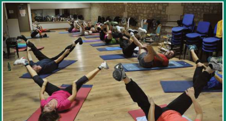
Le V de la victoire sur les raideurs de l'hiver !