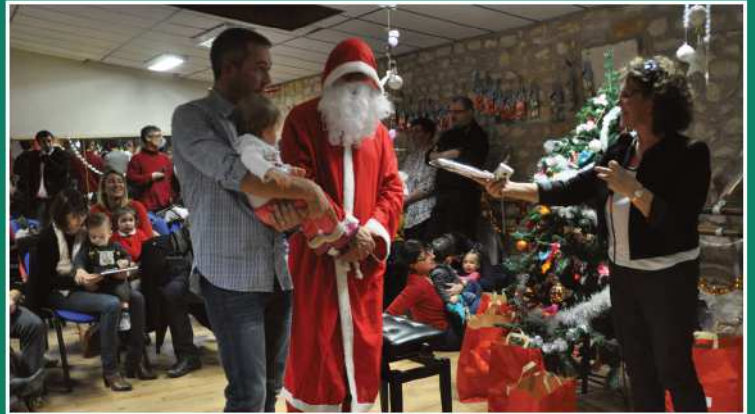
Le Père Noël était attendu depuis un an à la crèche.

55 bis, rue de la Boème - 16440 MOUTHIERS RENSEIGNEMENTS Mme Anne-Marie MARTIGNAC - 05 45 67 84 88