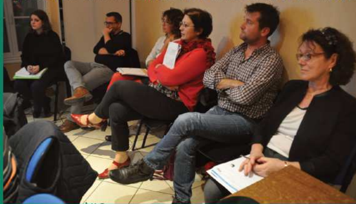
LES SERVICES ONT PRÉSENTÉ LES ACTIONS RÉALISÉES ET LES PROJETS

acquisitions foncières (50 %), les frais de géomètre et de notaire.