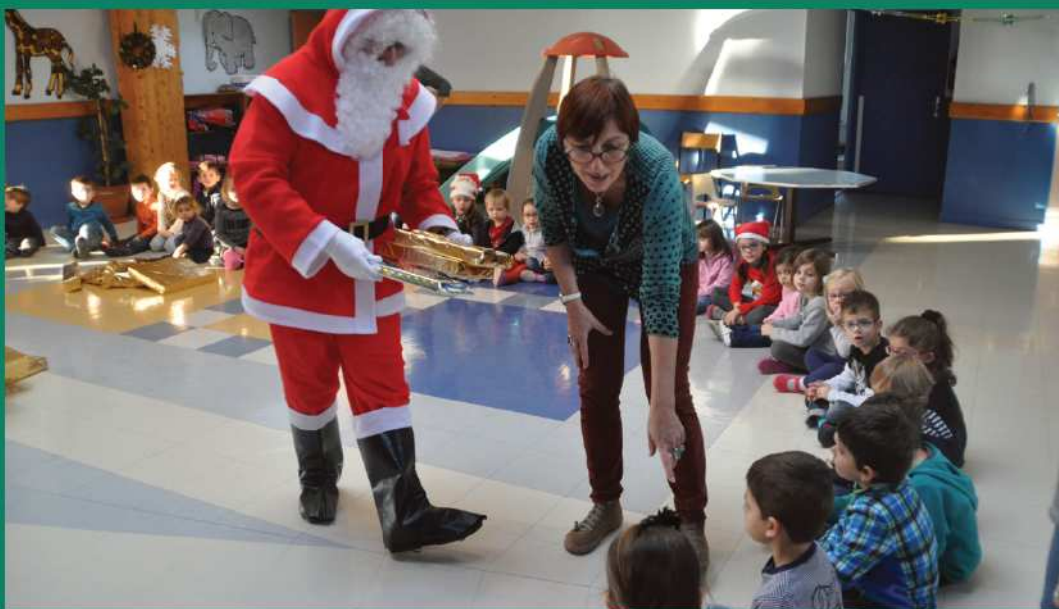
A l'école maternelle le Père Noël a rencontré la Mère Michelle..!