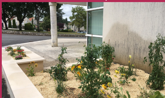
Aménagement devant la salle des mariages