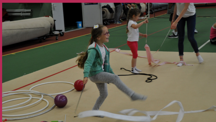
A la découverte des sports.