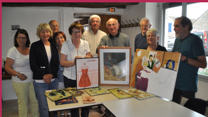
Patrimoine, revoir en peinture...