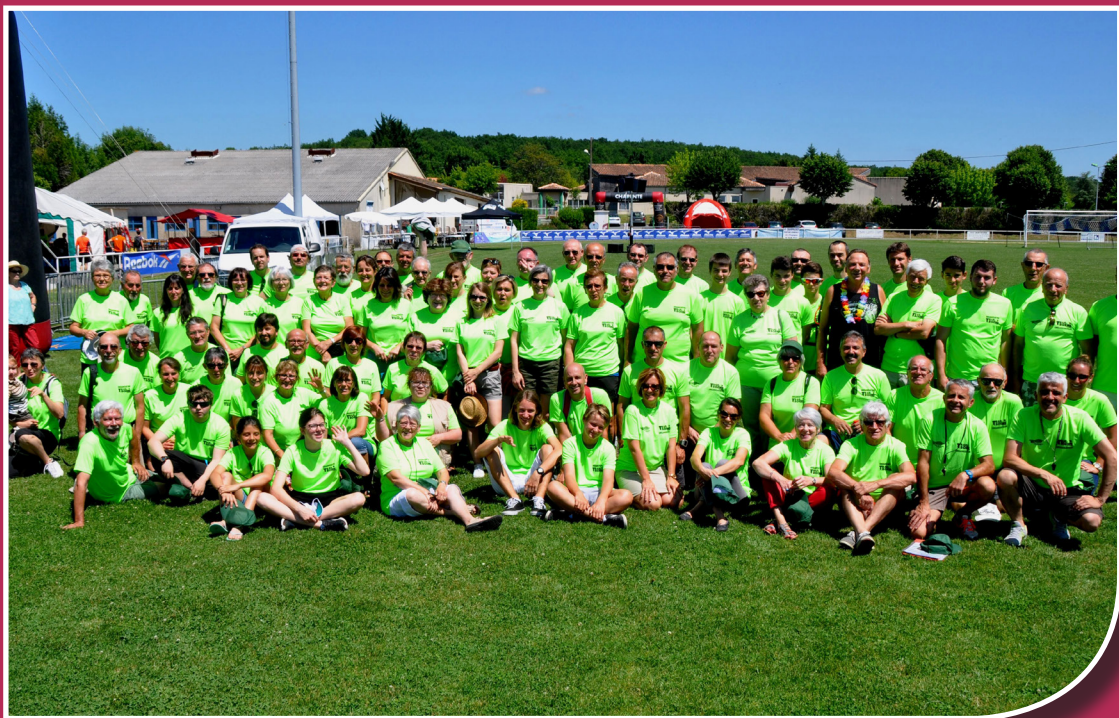
Trail grande réussite grâce aux bénévoles

Bulletin d'information locale édité sous la responsabilité de la municipalité de Mouthiers sur Boême