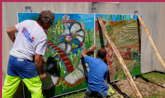
Installation des panneaux à l'école