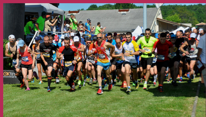
Foulées jeunesse !