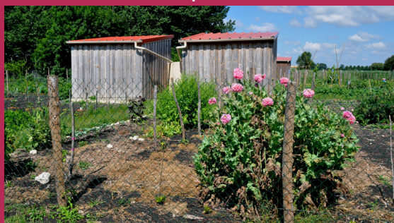
Les jardins familiaux au complet