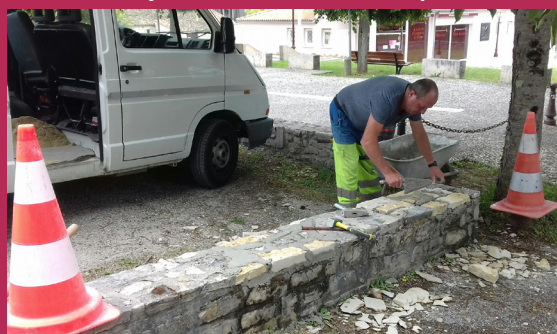
Réfection Muret Champ de Foire