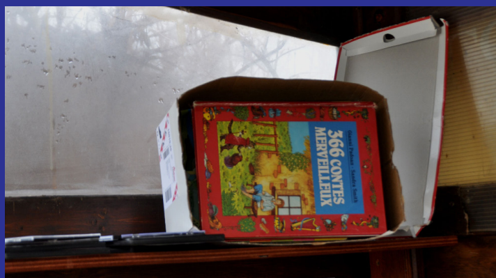
Une nouvelle boîte à livres dans un abri bus