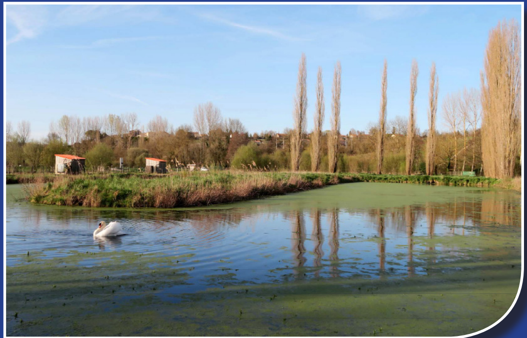
Prix " Coup de coeur "du public Festival de la biodiversité