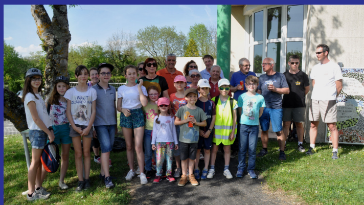
Les nettoyeurs de sentiers