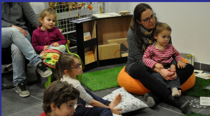
Opération "Petites oreilles en goguette !"