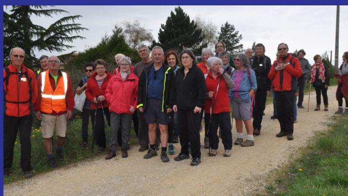
Randonnée solidaire du Secours populaire