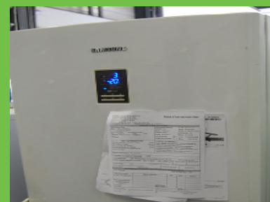
Réfrigérateur en cours de test

Cet objectif associatif d'insertion est à l'origine du soutien apporté par l'agglomération, pour le bâtiment initial, et celui du département dont les compétences en matière d'action sociale, trouvent une application locale : pour équiper les familles en difficultés, le département assurent le financement d'environ 35 000 € par an (les familles viennent au magasins pour trouver les matériels nécessaires qui après devis transmis au département leur est facturé de façon réduite). Cette seule disposition contractuelle a permis à ENVIE de garantir un petit tiers de l'activité nécessaire à l'équilibre financier de l'activité.