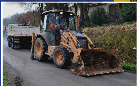
Curage des fossés Combe Noire