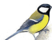
La mésange charbonnière