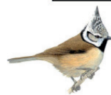
La mésange huppée