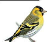
Le tarin des aulnes