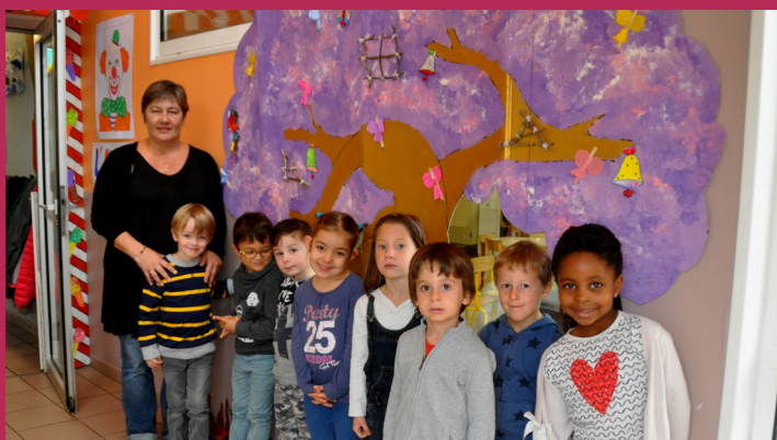
Ils ont fait l'arbre des fées