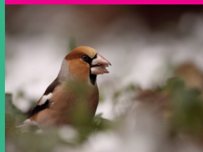
Grosbec casse-noyaux