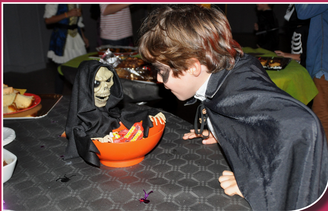
La Boum solidaire, l'occasion de crâner un peu...

Bulletin d'information locale édité sous la responsabilité de la municipalité de Mouthiers sur Boême