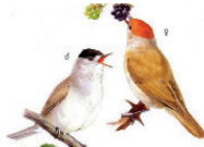
La fauvette à tête noire