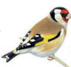
Le chardonneret élégant