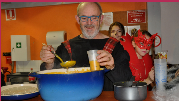
Boom Solidaire, c'est là que les potes iront...