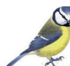
La mésange bleue