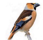
Le grosbec casse-noyaux