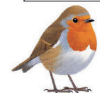
Le rougegorge familier