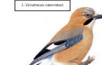
Le gai des chênes