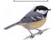
La mésange noire