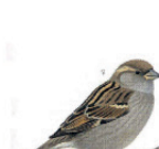
Le moineau domestique