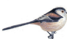
La mésange à longue queue