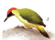
Le pic vert