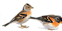
Le pinson du nord