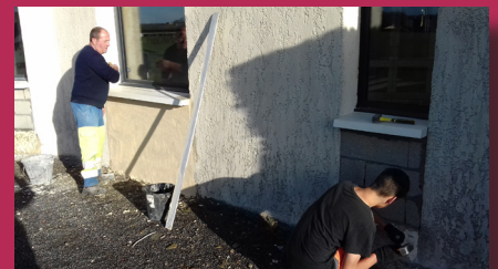
Réfection hall Salle Gilles Ploquin