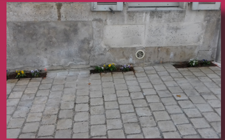
Pieds de mur, rue de l'église