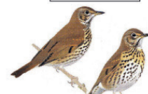
La grive musicienne