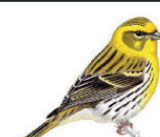
Le serin cini