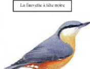
La sittelle torchepot