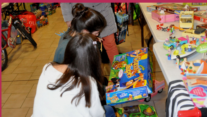
Super bourse aux jouets