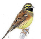
Le bruant zizi