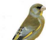
Le vendier d'Europe