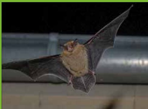
Pipistrelle de Kuhl