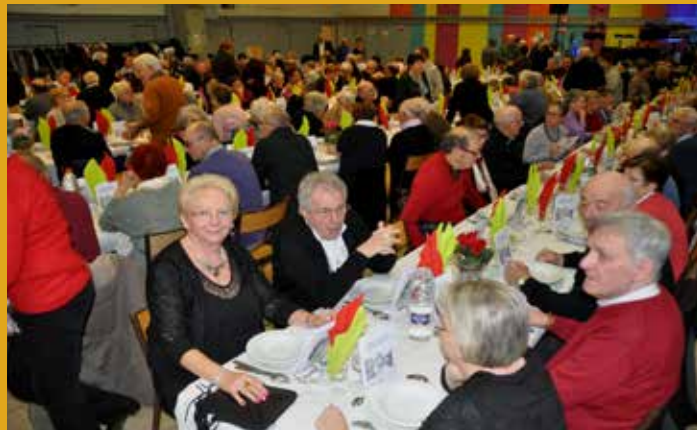
Repas des aînés : Mouthiers , t'as de beaux vieux tu sais !