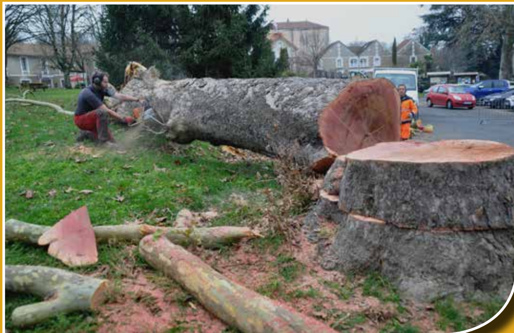
Un géant abattu... mais le champ de foire restera un lieu branché !