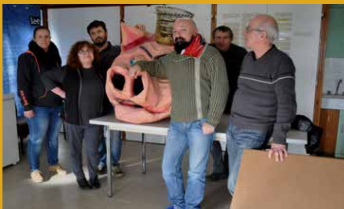
Y'a du carnaval dans l'air !